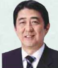
元内閣総理大臣 基調講演兼パネラー:安倍晋三