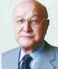
評論家 パネラー:三宅 久之